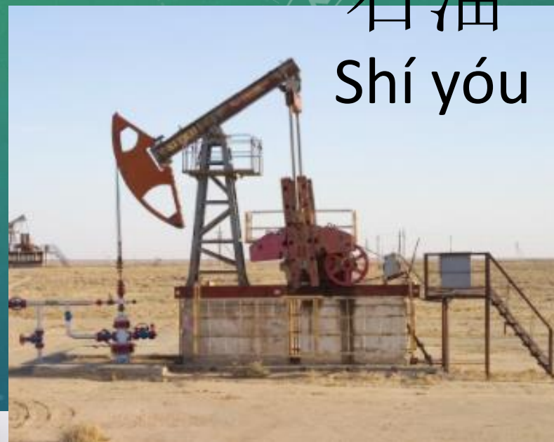
石油 Shí yóu