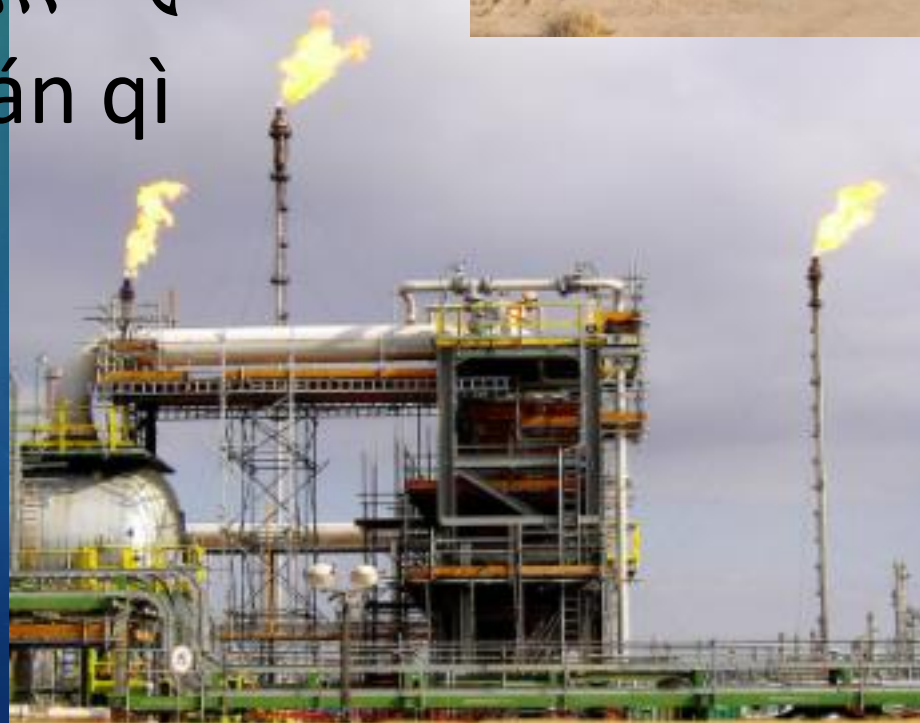
天然气 tiān rán qì