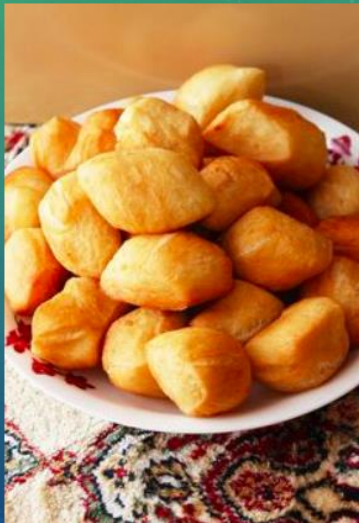
面包 Miàn bāo