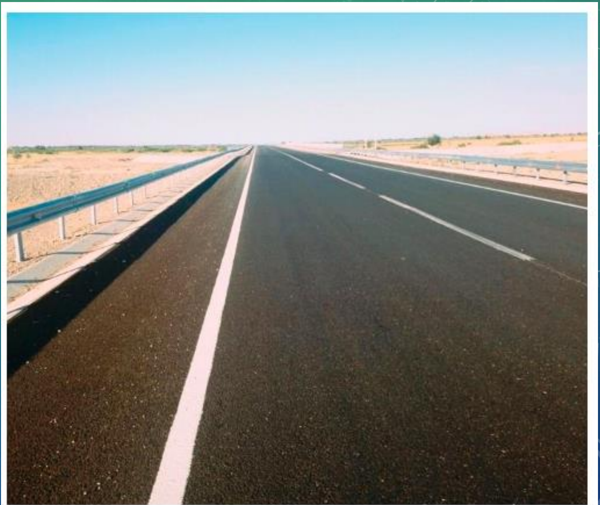
“西欧-中国西部”走廊已完成部分