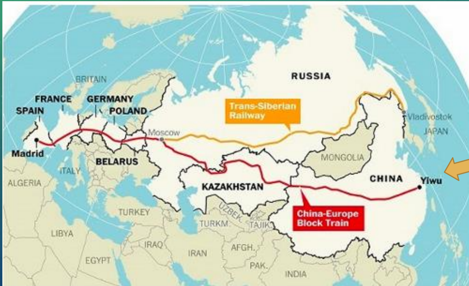
铁路运输通道预计路线